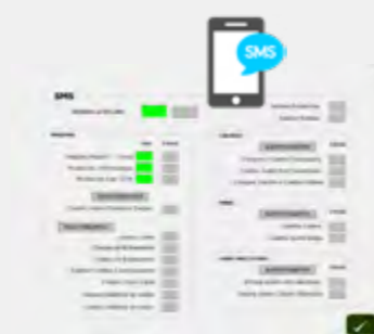
Control de producción