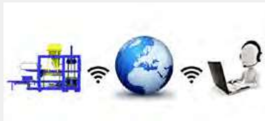
Soporte técnico Online