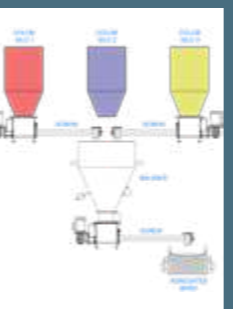
Dosificador de colores